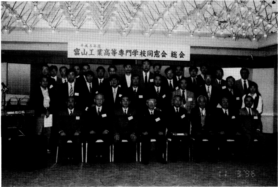
開会前・集合 遅れて来た人は写っていません。あしからず。