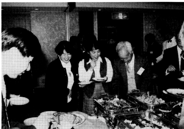
おいしい料理とアトラクション